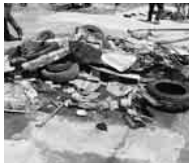
I RIFIUTI RIMOSI

Acireale. E' riuscita perfettamente la prima «Festa del mare», domenica bis dei volontari a S. Tecla