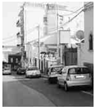
AUTO PARCHEGGIATE A CAPOMULINI